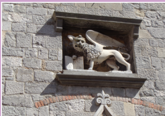
Abbildung oben: Der Löwe als Symbolfigur war und ist von großer politischer und religiöser Bedeutung: Er drückt nicht nur Stärke und Majestät aus, sondern versinnbildlicht auch die Kraft des Wortes des Heiligen, geistige Erhebung durch seine Flügel, Weisheit durch das unter der Tatze liegende Buch und schließlich Gerechtigkeit wegen der Anwesenheit des Degens..

Abbildung links: Der Hl. Markus, dargestellt mit einem sitzenden Löwen, geschnitzt von Hans Pendl.