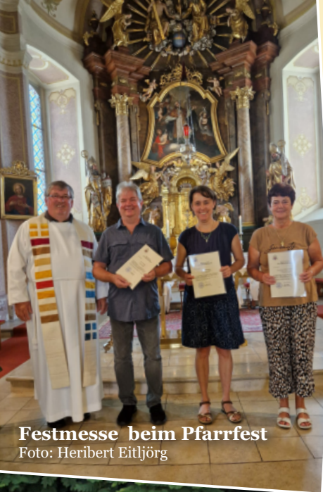
Festmesse beim Pfarrfest