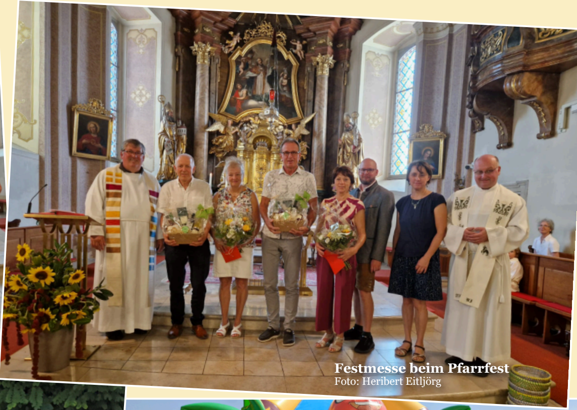
Festmesse beim Pfarrfest